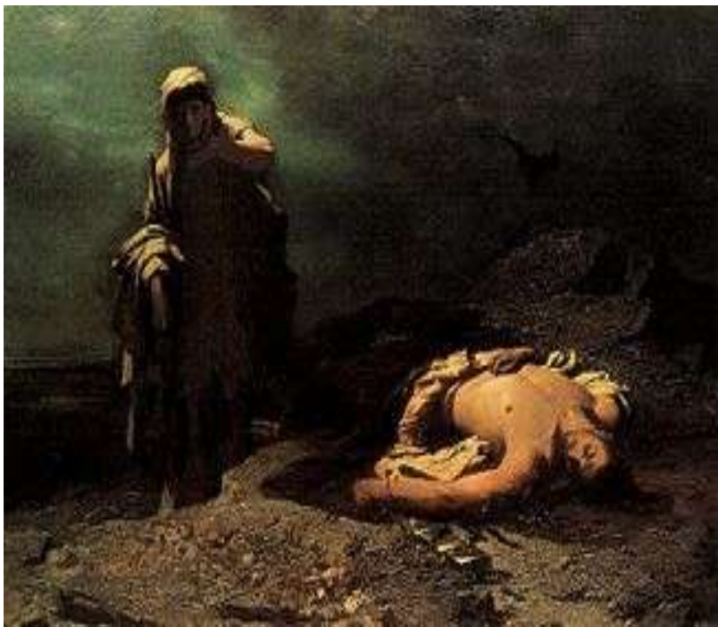
Η Αντιγόνη εμπρός στο νεκρό Πολυνείκη (1865). Λάδι σε καμβά. Εθνική Πινακοθήκη της Ελλάδας - Μουσείο Αλεξάνδρου Σούτζου.