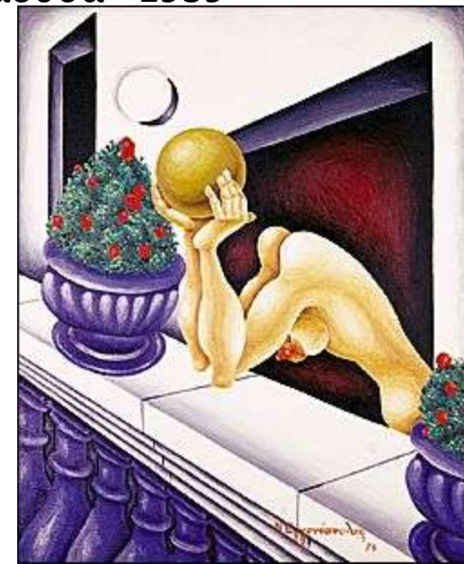
“Στο μπαλκόνι” 1978, Εγγονόπουλος