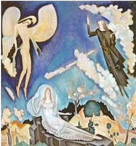
Κ. Παρθένης, Αποθέωση του Αθανασίου Διάκου (1931). Ελαιογραφία. Συλλογή Ιδρύματος Σπ. Λοβέρδου.

Κωνσταντίνος Παρθένης ήταν διακεκριμένος Έλληνας ζωγράφος. Η «ελληνικότητα» των έργων του, και η επίδραση των έργων του στις κατόπιν γενεές Ελλήνων ζωγράφων τον κατατάσσει στους προδρόμους και διαμορφωτές της «Γενιάς του '30».