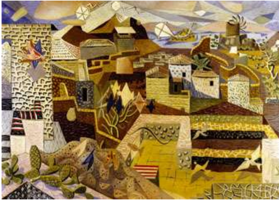
Ν. Χατζηκυριάκος - Γκίκας, Διαλογισμοί και αντιφεγγίσματα (1936) λάδι σε καμβά. Εθνική Πινακοθήκη και Μουσείο Αλεξάνδρου Σούτζου, Αθήνα.